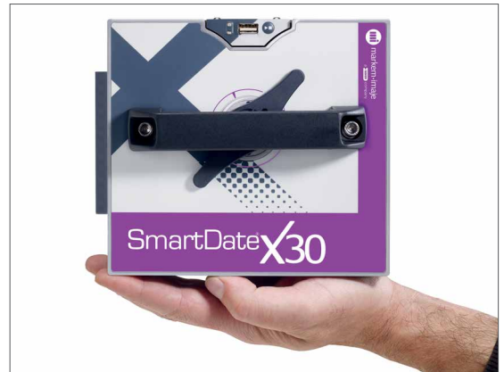
Компактный размер для простоты интеграции. SmartDate X30 – самый маленький из принтеров серии SmartDate

Единый доступ для получения экспертной поддержки как по маркировщикам, так и по расходным материалам.