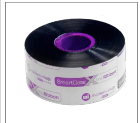
Выбор из трех типов лент и серии аксессуаров в зависимости от Ваших потребностей и типа упаковки.