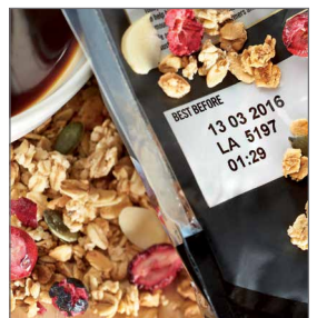
Эффективное сервисное обслуживание, гарантирующее время работы принтера и качество маркировки продукции.